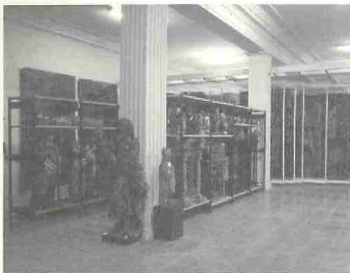
La sala de reserva és a l'edifici de la plaça de la Llibertat