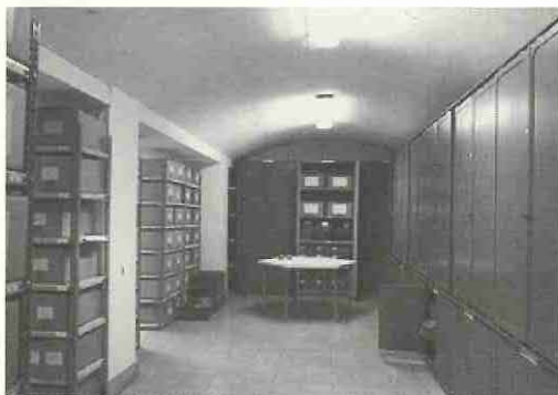
Caixa forta de l'antiga seu del Banc d'Espanya a Reus

en humitat i temperatura, ja que poden aparèixer fongs i insectes. La llum pot ser molt nociva, ja que provoca decoloració, dessecació i esgrogueïment. La llum natural és molt difícil de controlar, per això preferim la llum artificial, evitant sempre les radiacions d'infrarojos i ultravioleta, que produeixen efectes químics i fotoquímics, respectivament. És important aconseguir en l'interior d'un magatzem una qualitat de puresa en l'atmosfera per evitar la brutícia sobre els objectes (s'ha d'evitar la contaminació de gasos CO 2 i SO 2 ).