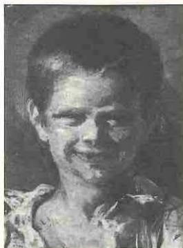
El nen de Portici, de Fortuny

E l MCSV mostra a les instal·lacions de la plaça de la Llibertat durant els mesos d'estiu una part representativa de l'obra de cinc artistes reusencs de gran projecció exterior: Marià Fortuny, Antoni Gaudí, Joan Rebull, Modest Gené i Josep Llovera. Es tracta d'una trentena de peces en propietat del MCSV que feia temps que no s'exposaven al públic i que, durant la temporada estival, poden servir de doble reclam: per una