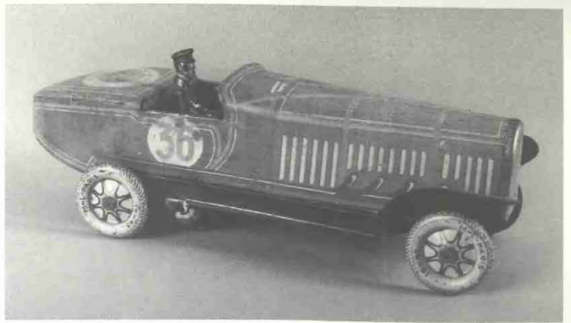
Un vehicle de llauana que forma part de l'exposició de joguines

E n el món dels adults les joguines adquireixen nous valors: sentimentals, estètics i comercials. Moltes joguines antigues són belles obres d'artesanía. Altres són veritables mostres d'un treball acurat que reproduceix, a petita escala, els mecanismes i les funcions de màquines emprades en l'activitat quotidiana. La curiositat i la singularitat atorga a d'altres un valor especial. Per tot això i més, les joguines esdevenen objecte de col·lecció.