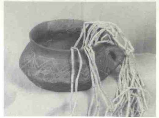
Ceràmica de la Cova M del cingle blanc d'Arbolí

E l fons del MCSV conserva un dels conjunts ceràmics de la prehistòria recent catalana i peninsular més interessants però a la vegada també un dels més desconeguts. Ens referim a les produccions ceràmiques que hom coneix sota el nom de tipus Arbolí o estil Arbolí, car el lloc on foren millor documentades fins fa poques dècades fou en les coves del Cingle Blanc d'Arbolí.