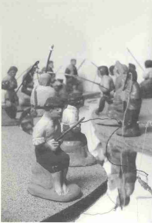
Figures de pescadors. Foto inferior: un caganer