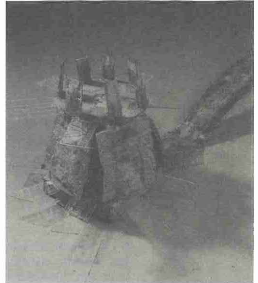
possible tant la capacitat com la qualitat creativa dels seus artistes.

Evidentment, aquesta és una col·lecció encara incipient. Li queda un llarg camí per recórrer perquè es consolidi, tingui un pes específic i esdevingui representativa de l'art realitzat en el present, en el nostre entorn més immediat. Per això, cal una política d'adquisicions que incorpori més obres d'aquells artistes vinculats a casa nostra, i que no es limiti a les obres guanyadores dels premis abans esmentats. Confiam que, en un futur no gaire llunyà, la ciutat de Reus pugui gaudir d'una col·lecció que reflecteixi tan fidelment com sigui