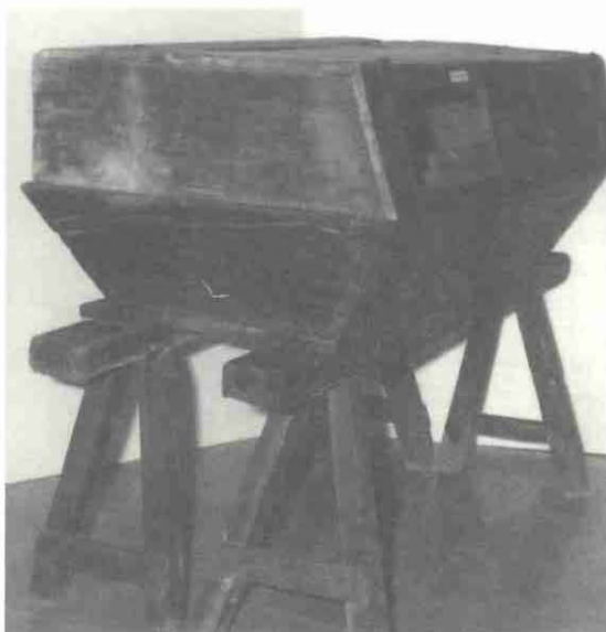
Albarca: pastera per pastar la farina.