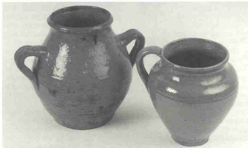
Mesura i tupí (MCSV)

U na exposició per mirar amb calma, que en el període estival us vol oferir el Museu Comarcal Salvador Vilaseca. ♦