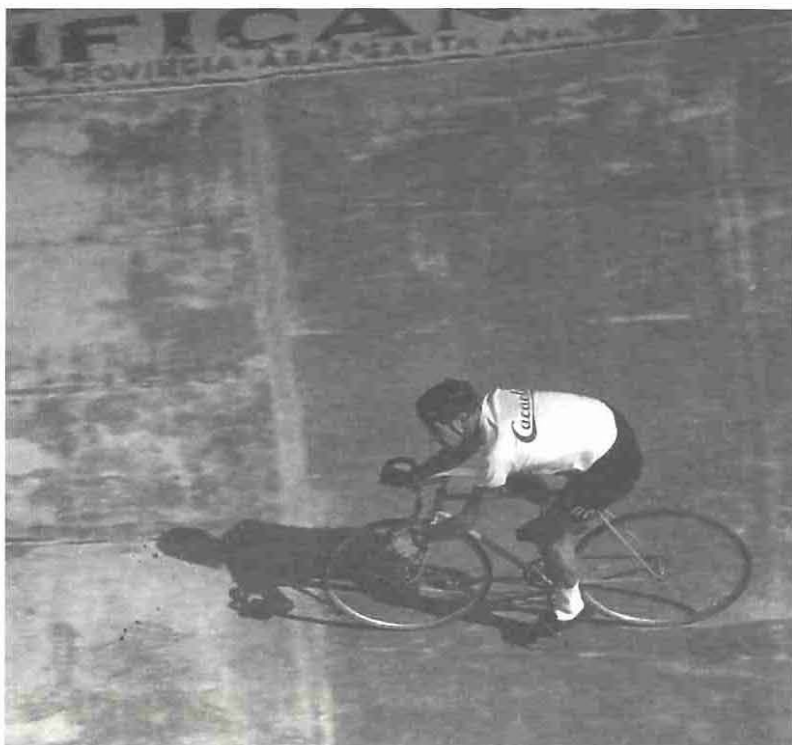
L'últim velòdrom reusenc, el Cicles Catalunya

de l'Estat. Es va iniciar el 1909, organitzada pel Club Ciclista El Pedal, de Tarragona, encara que no tingué continuïtat i només es va córrer puntualment el 1918, el 1948 i el 1954. El 1963 es va organitzar de nou, per l'interès de la Fira de Reus, organitzada per la secció ciclista del CN Reus Ploms, que se'n va fer càrrec definitivament l'any següent. Aquest any ja es va disputar en quatre etapes i al 1965 va augmentar a cinc, tal com la coneixem actualment. La prova té avui un caràcter internacional per a ciclistes aficionats de primera i segona categoria. Amb el pas dels anys s'hi han afegit diversos trofeus, concedits a la memòria de