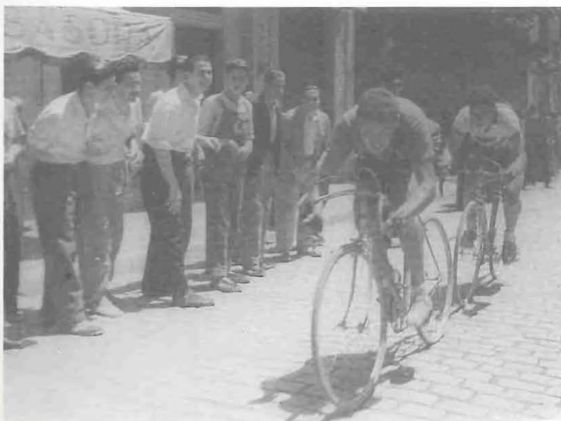
Cursa interclubs a Reus, 1951

T ot i que els primers anys de segle se celebraren algunes competicions, el velòdrom es