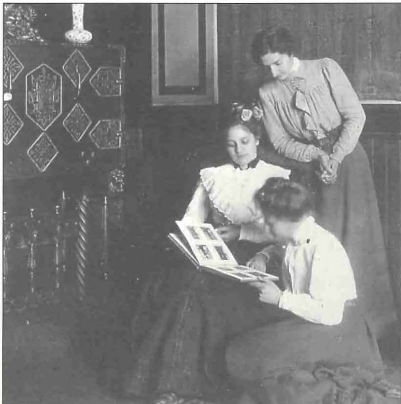
Fotografies familiars al mas de Misericòrdia

P au Font impulsà el tramvia de Reus a Salou, el pantà de Riudecanyes (i a les diverses temptatives frustrades de fer un embassament amb les aigües de la conca del francolí) i el psiquiàtric Pere Mata, entre d'altres iniciatives d'impuls modernitzador de l'economia comarcal. Participà en d'altres iniciatives econòmiques com els laboratoris Serra, en diverses empreses vinculades amb la família Vilella, impulsà l'explotació d'uns salts d'aigua al Pirineu aragonès o una fàbrica de productes químics a la província de Terol. Preocupat pel desenvolupament agrícola intentà fundar al